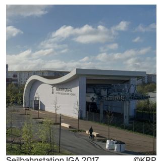
Seilbahnstation IGA 2017

„Wolkenhain“ Berlin-Marzahn Errichtung eines Aussichtsbauwerks mit gastronomischen Einrichtungen auf dem Kienberg in Berlin-Marzahn für die IGA 2017