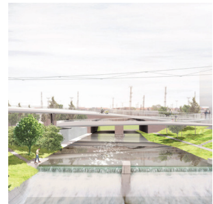
FG-Brücke Promenadendeck