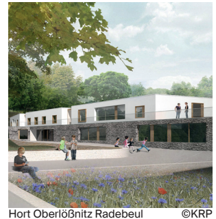
Hort Oberlößnitz Radebeul

Hort Oberlößnitz Radebeul Planung eines Horts für 250 Kinder in einer historischen Parkanlage in Radebeul