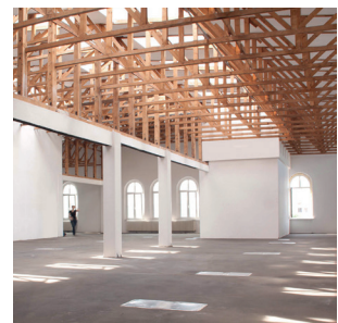
Ehemalige Bockbrauerei