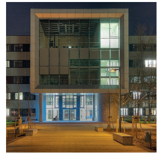
Hauptgebäude BTU Cottbus ©KRP