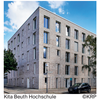
Kita Beuth Hochschule

Evangelische Schule Berlin Neukölln Sanierung und Erweiterung einer Schule aus der Mitte der 1950er Jahren, Neubau eines 5-zügigen Oberstufenzentrums mit Sporthalle