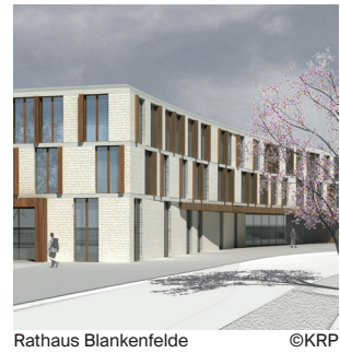
Rathaus Blankenfelde