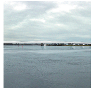
Neubau Elbebrücke