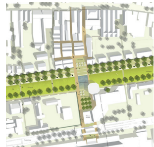
Rathauspassage Georgswall