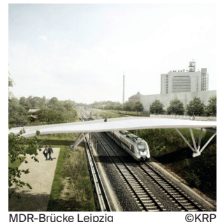
MDR-Brücke Leipzig

Stationsgebäude der Seilbahn IGA 2017 Berlin-Marzahn Errichtung von drei Stationsgebäuden, eines mit gastronomischen Einrichtungen, der Seilbahn für die IGA 2017