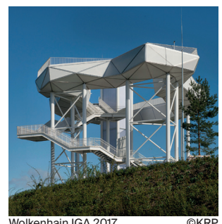
Wolkenhain IGA 2017

PV Tempelhof, Berlin Machbarkeitsstudie für PV-Anlage auf dem Eingangsbauwerk des ehem. Flughafen Tempelhof