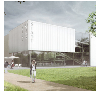
Museum „Zeit-Werk-Stadt“