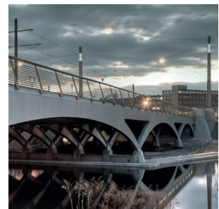
Lange Brücke Potsdam