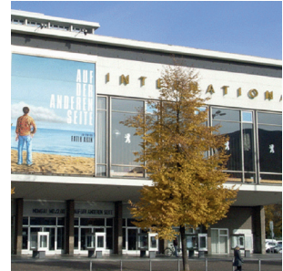
Kino International