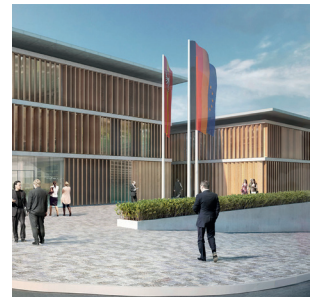
Neubau Amtsgericht Günzburg